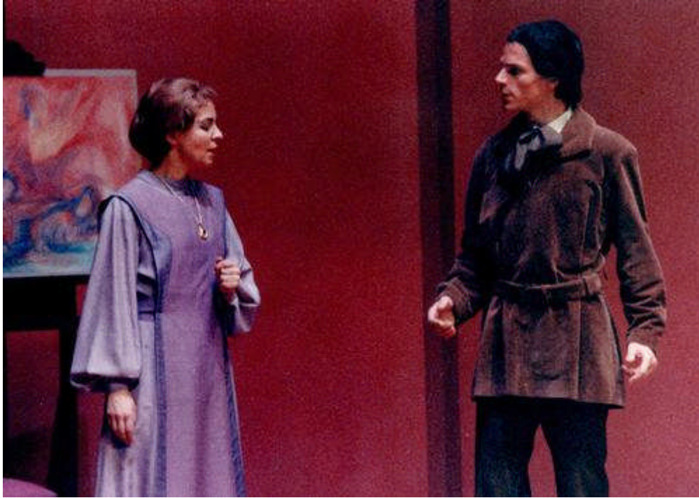
Maria en Johannes voor het schildersdoek

In het vierde beeld ontmoeten wij onze twee vrienden Capesius en Strader. Strader is in een diepe crisis terechtgekomen. De openbaring van de etherische Christus doorheen Theodora in het eerste beeld van “Die Pforte” en de confrontatie met het portret van Capesius in het achtste beeld hebben zijn wetenschappelijke zelfzekerheid onderuit gehaald. Hij heeft de leiding van een kleine fabriek op zich genomen om door het praktische werk los te komen van zijn vele innerlijke vragen en onzekerheden. Toch blijft hij denkend zoeken. Vanuit eigen kracht komt hij zo tot het inzicht dat de leer van karma en reïncarnatie op waarheid moet berusten. Dit is het inmiddels in de antroposofische literatuur beroemd geworden Straderbewijs. Niet schouwend maar bewust denkend komt hij tot dit besef. In zijn boek Theosofie ontwikkelt Rudolf Steiner trouwens een gelijkaardige gedachtegang.