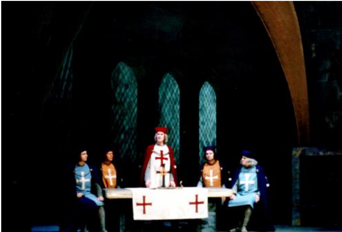
Grootmeester en ridders van de middeleeuwse orde

Er zijn nog vele boeiende belevenissen in deze middeleeuwse incarnatie te schetsen maar dit zou ons nu te ver voeren.