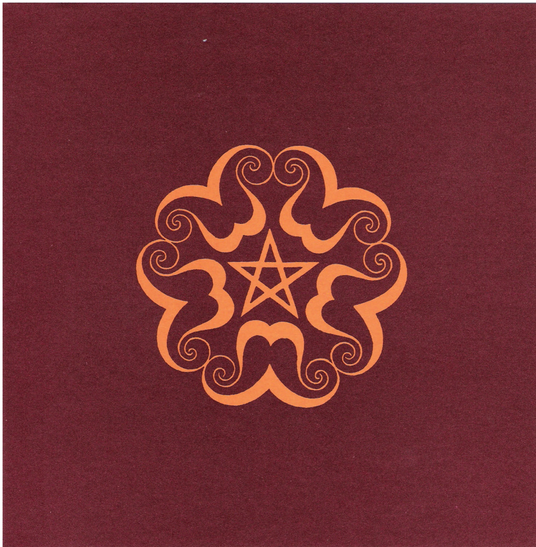
Siegel von Rudolf Steiner auf dem Bucheinband für „Die Prüfung der Seele“

We zullen dit drama weer afsluiten met een prachtig zegel dat beeldmatig het hele gebeuren samenvat.